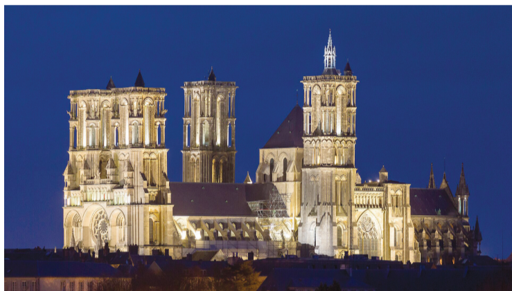
La cathédrale de Laon, de style gothique primitif, est située sur une colline creusée de carrières qui ont permis sa construction.